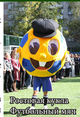
Ростовая кукла Футбольный мяч

Свое мастерство в создании кукол педагоги колледжа передают своим студентам, чтобы те в свою очередь несли это искусство по жизни.