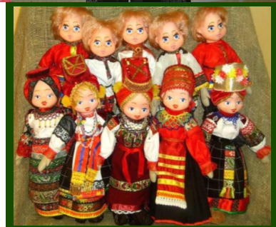
Куклы в народных костюмах Воронежской губернии