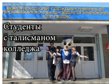
Студенты с талисманом колледжа

Но человек который создает кукол, может дать верный ответ на этот вопрос, потому что для него кукла - это не просто кусок пластмассы с нейлоновыми волосами, кукла - это месяцы напряженной работы, во время которой руками мастера создается неповторимый образ.