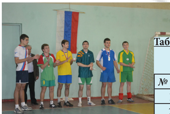
Таблица Розыгрыша кубка ВГППК по волейболу среди юношей